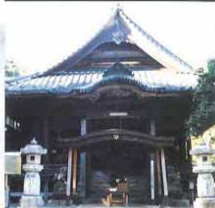
Damine Juichi Kwanzeonbosatsu