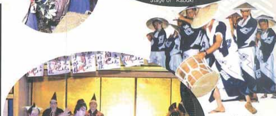
念仏踊 Nenbutsu Odori