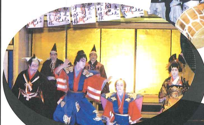
素人歌舞伎 Amateur Kabuki