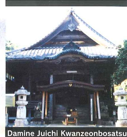
Damine Juichi Kwanzeonbosatsu