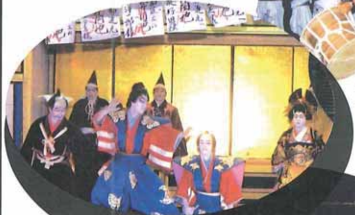
素人歌舞伎 Amateur Kabuki